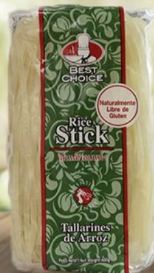
Tallarines de Arroz